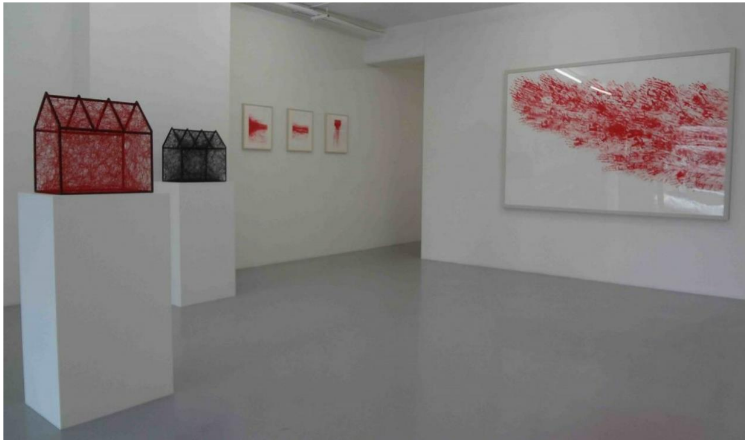
展示風景、右right：「Red Line XVII」2012