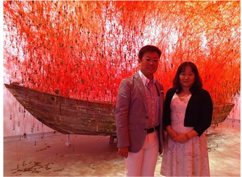
第56屆威尼斯雙年展國際美展日本館展覽現場（展廳）