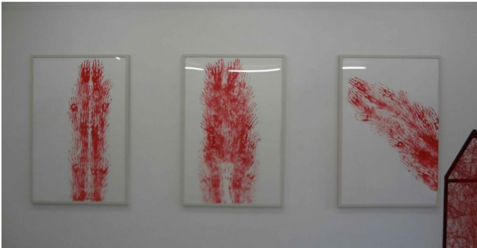
塩田千春 「Red Line XVIII」 「Red Line XIX」 「Red Line XX」 each 2012