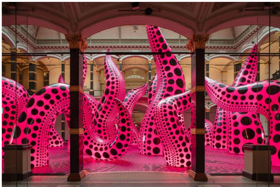
草間彌生在德國的大型回顧展 2021年8月15日 柏林Gropius Bau博物館